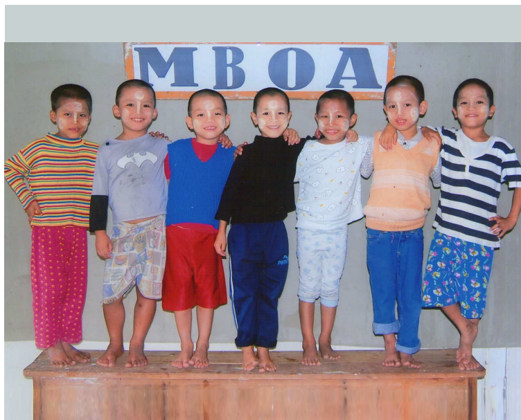
Einige unserer Fünfjähriger