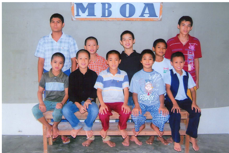
Obere Reihe (von links nach rechts):